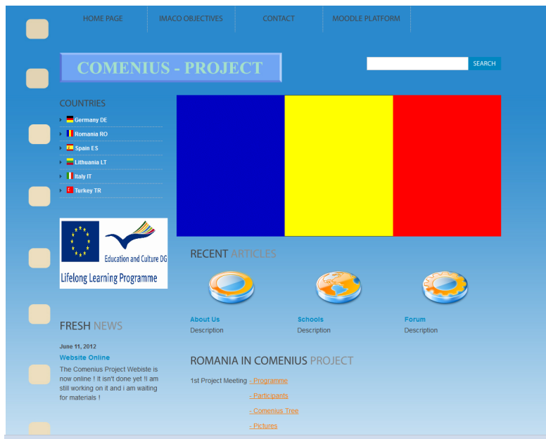
Die Website-Variante unserer rumänischen Partnerschule

Auf unseren Projekt-Webseiten präsentieren wir unsere Projektergebnisse im Internet: