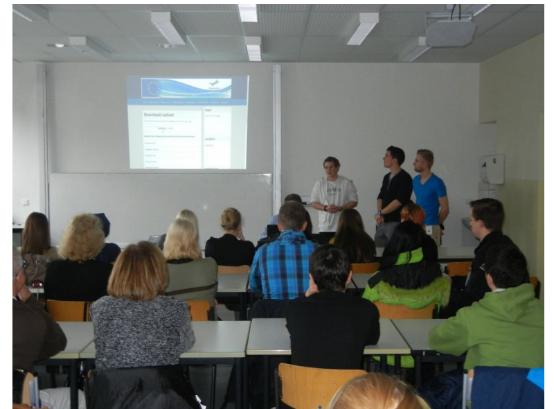
Präsentation der „deutschen“ Variante